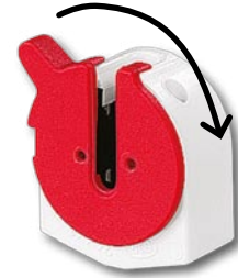
Pratik rotor döndürme yardımı, T5 ampullerinin özellikle çok dar gövdelere kolay bir şekilde takılmasını ve bu gövdelerde T5 ampullerinin kolay değiştirilmesini sağlıyor